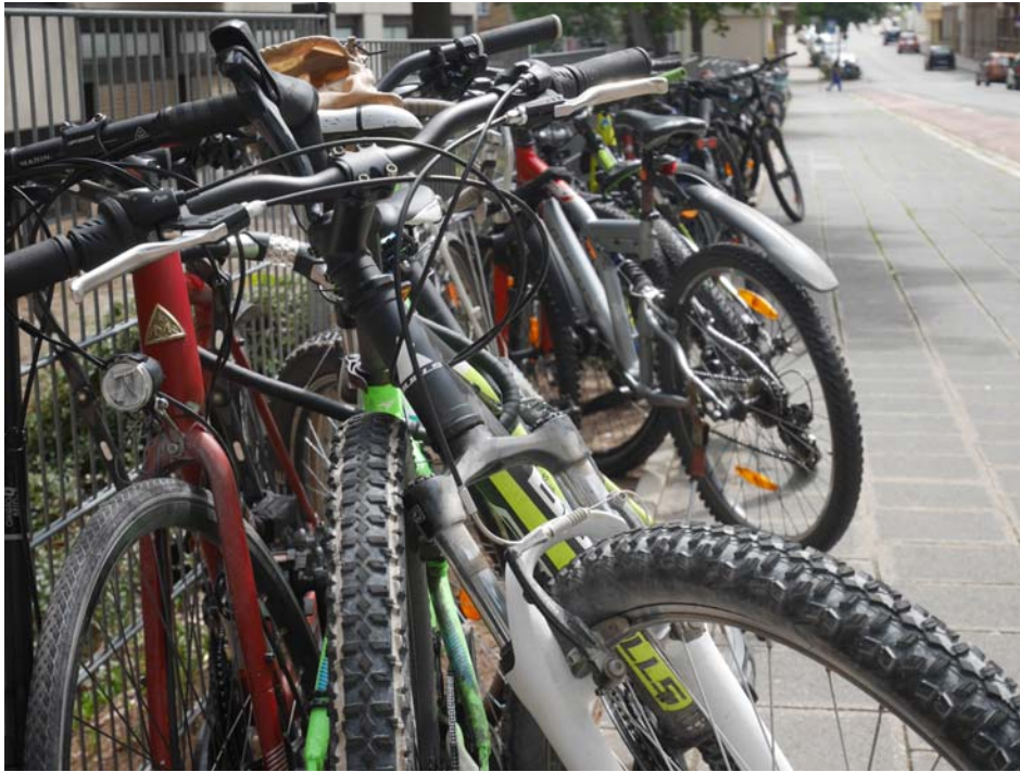
Bild 2: Beispiel für eine sehr gelungene Umsetzung an der Soldnerschule